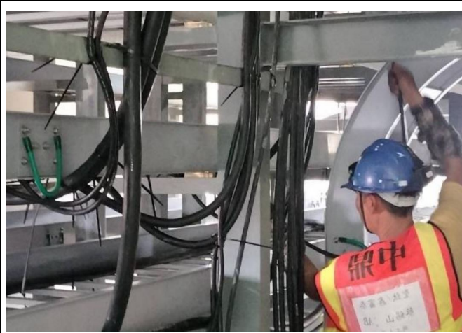
主發電設備工程 Unit 1 ST 廠房 電纜拉設