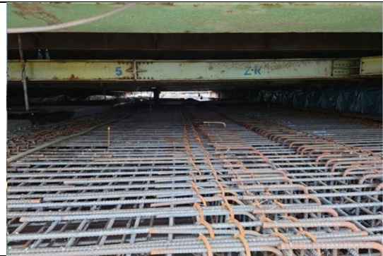
冷卻循環水系統工程 出水暗渠 結構體